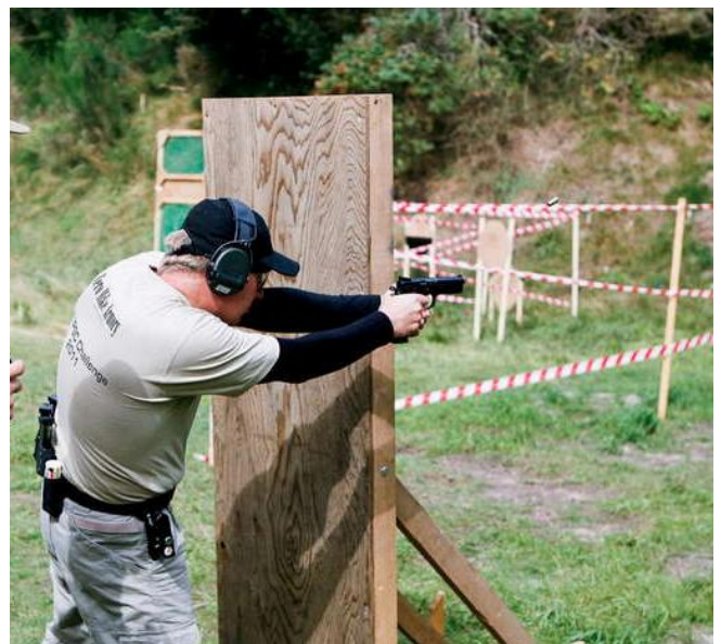
Der bliver skudt udenom forhindringer..

Så på trods af en ikke ligefrem storartet præstation, kan det altså godt lade sig gøre at vinde alligevel.. Smilet var derfor stort på den lange køretur hjem, hvor vi godt trætte kunne diskutere hvor forskelligt vi tre havde grebet skydningerne an, og forsikre hinanden om at næste gang – så skyder vi i hvert fald bedre.