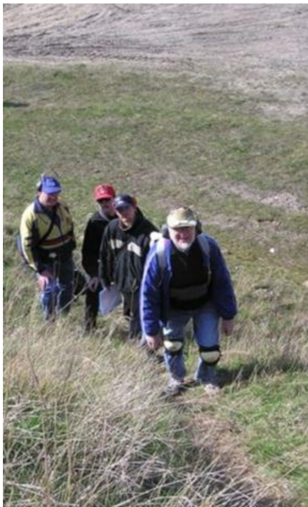
FOTO:Kulsbjerg i april- drengene på bjergbestigning

Igen var vi en tur på Kulsbjerg, som i mine øjne nok er det smukkeste terræn vi har her i landet til terrænskydning.