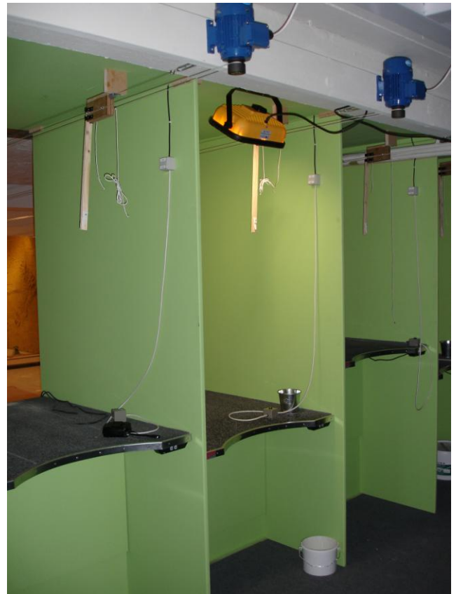
15 meter banen færdig

Vi startede nedrivningen af 15 meter banen d. 9. december, hvor alle brugere af banerne var til stede, men med stort overtal fra vores egne rækker, standpladsborde, skivetræk og væg ved kuglefanget blev pillet ned. Der er siden blevet nedrevet mur, malet og opsat nye hæve/sænkeborde. Vi skal så have opsat automatikken til de nye skivetræk i weekenden, så vi kan komme i gang igen.